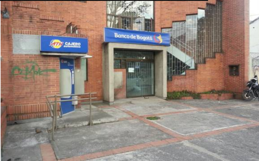
Daños materiales en esta sede bancaria y en apartamentos aledaños del sector de Teusaquillo dejó la explosión.

BOGOTÁ ELN ORDEN PÚBLICO RODOLFO PALOMINO